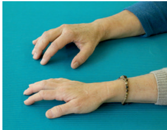
Abb. 5: Die hintere Hand weist eine koordinierte Grundhaltung auf, während die vordere Hand eine Achsenabweichung sowie ein abgeflachtes Handgewölbe zeigt.

► Setzen Sie sich in aufrechter Haltung an einen Tisch. Die Tischplatte sollte sich in Ellbogenhöhe be-