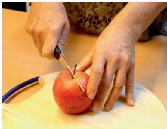
Abb. 13: Unkoordiniertes Schneiden.

► Nehmen Sie einen Apfel und schneiden diesen mit einem Messer in Stückchen. Versuchen Sie dabei, unter Einbezug eines aktiven Handgewölbes den Apfel festzuhalten, während Sie mit der anderen Hand das Messer ökonomisch halten und die Schnittbewegung ausführen. Beachten Sie hierbei, dass der Kleinfinger den Messerschaft gut umschlossen hält (aktiver Kleinfingerpol). Der Zeigefinger liegt auf dem Messerrücken, während der Daumen seitlich am Messer anliegt