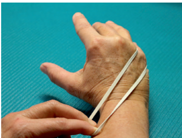
Abb. 6 und 7: Kleinfingerabduktion und Opposition kräftigen.