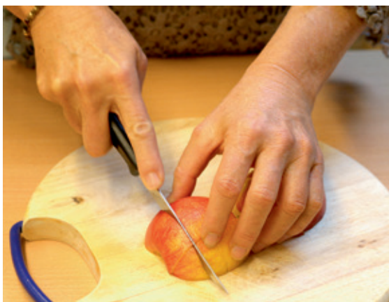
Abb. 14: Das Gelernte wurde in eine ökonomische Tätigkeit umgesetzt.

(mobiler Daumenpol). Achten Sie darauf, dass Ihre Hand beim Schneiden zentriert ist (Abb. 14).