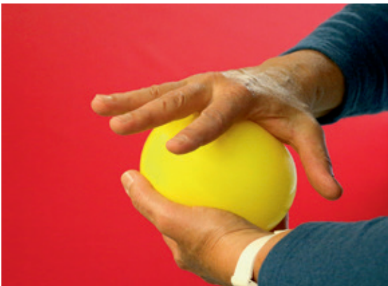
Abb. 3 und 4: Wahrnehmungsschulung mit einem Ballon

mit der anderen Hand halten Sie ihn. Versuchen Sie, den Ballon mit den Mittelhandknochen von Daumen und Kleinfinger zu umfassen. Achten Sie darauf, dass ihre Finger entspannt bleiben und die Hand in der Längsachse ausgerichtet ist (Abb. 3). Führen Sie die Pole wieder zurück und wiederholen Sie diese Aktivität ein paarmal nacheinander (Abb. 4).