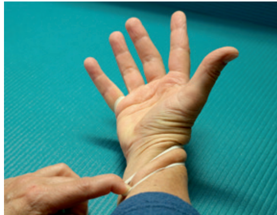
Abb 12: Kleinfingeropposition in Kombination mit der Supinationsbewegung.

Ein schwacher Hypothenar kann zur Folge haben, dass der Daumen auf Grund seiner Oppositionseigenschaft über seine natürlichen Begrenzungen hinwegzieht. Häufig ist dies durch eine Verdrehung zwischen Hand und Unterarm ersichtlich. Die Hand steht dann in einer leicht verdrehten Pronationstellung zum Unterarm. Es entsteht ein „Sehnenknick“ im radialen Handgelenksbereich. Betroffen sind die Sehnen im ersten Streck-