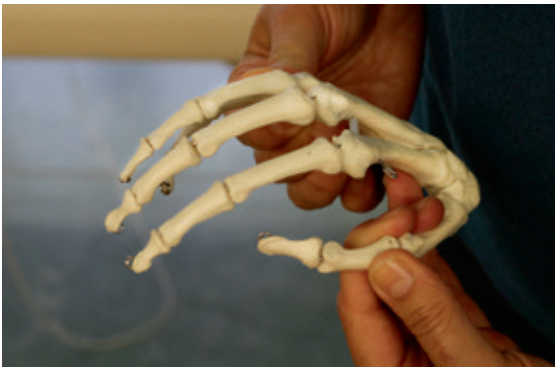
Abb. 1 und 2: Bipolare Führung der Hand

das Handgewölbe wieder ab. Beide Pole bedingen und begrenzen sich. Ist ein Pol insuffizient oder schwach, hat dies eine direkte Auswirkung auf den anderen. Die Handfunktion orientiert sich in die Breite und nicht, wie viele denken, in die Länge!