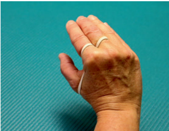
Abb. 10 und 11: Die Auf- und Verspannung durch den Adduktor Pollicis

und Zeigefinger ist eng und schmal, manchmal in Kombination mit einer Überstreckung im Daumengrundgelenk. Der Mittelhandknochen des Daumens steht nicht mehr kongruent im „Sattel“. Bei jeder Greifbewegung entstehen durch diese Gelenkinkongruenzen dramatische Belastungsspitzen im Sattelgelenk. Symptomatischen wie Rhizarthrose sind hier vorprogrammiert.