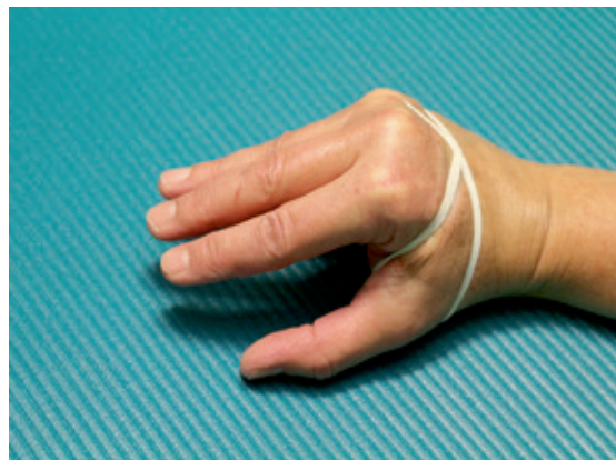
Abb. 8 und 9: Mit einem Gummiband lässt sich das Handgewölbe einfach aber effektiv trainieren.