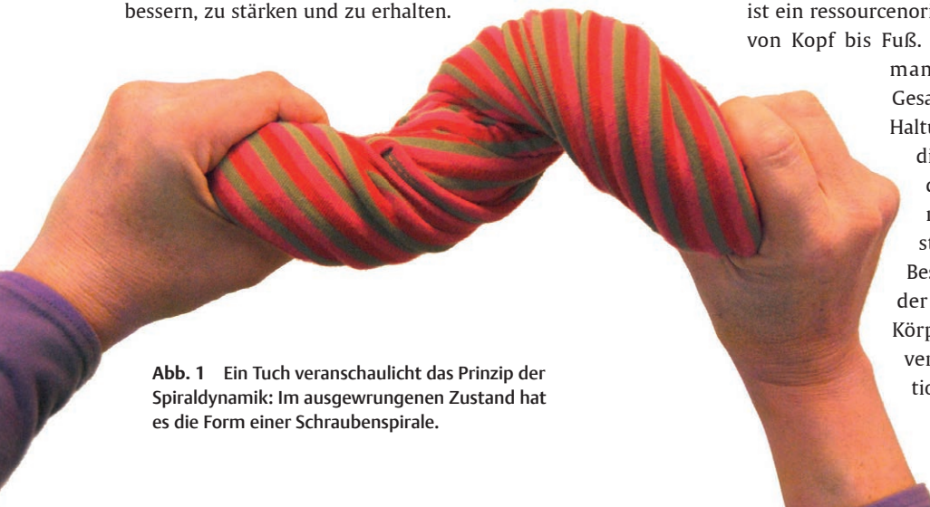
Abb. 1 Ein Tuch veranschaulicht das Prinzip der Spiraldynamik: Im ausgewrungenen Zustand hat es die Form einer Schraubenspirale.

In der funktionell orientierten Therapie befassen sie sich mit der Sensomotorik. Hier kann das Konzept der Spiraldynamik ein wertvolles Analyse- und Behandlungsmodell sein. Die Spiraldynamik ist ein ressourcenorientiertes Bewegungs- und Therapiekonzept von Kopf bis Fuß. Von diesem Modell ausgehend behandelt man das Bewegungsverhalten in seinem Gesamtzusammenhang. Dabei analysiert man die Haltung und beobachtet Bewegungsabläufe, um so die Ursachen für Fehlkoordination und Muskeldysbalance zu erkennen. Das ermöglicht eine nachhaltige und effiziente Behandlungsstrategie, unabhängig vom Alter oder dem Beschwerdebild eines Klienten. Im Vordergrund der Spiraldynamik stehen Wissensvermittlung, Körperwahrnehmung, Bewegungslernen, Eigenverantwortung, Selbstständigkeit und Integration in den Alltag.